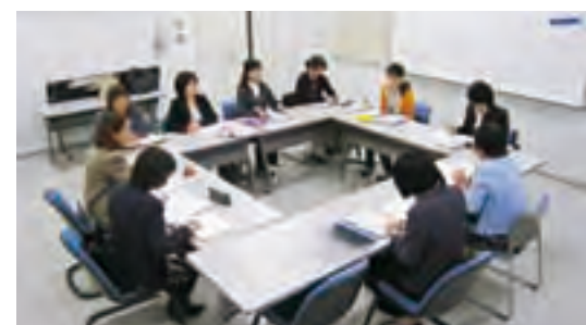
実践看護学構築論Ⅰの授業風景

科学的根拠に基づく実践(Evidence-Based Practice)の実現を目的とし、より質の高い看護を提供するための教育・研究ができる人材及びスタッフ・ディベロップメント(SD)とファカルティ・ディベロップメント(FD)を支援できる人材の育成を目指します。