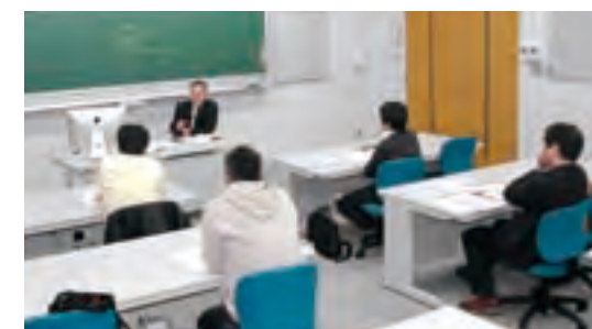
放射線管理計測学特論の授業風景

特別研究を通じて、診療放射線学の発展に貢献しつつ高度医療専門職者、研究者及び教育者としての基礎的能力を持つ人材を育成します。