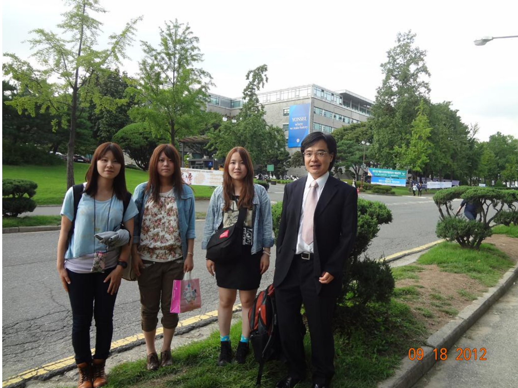
延世大学キャンパスにて