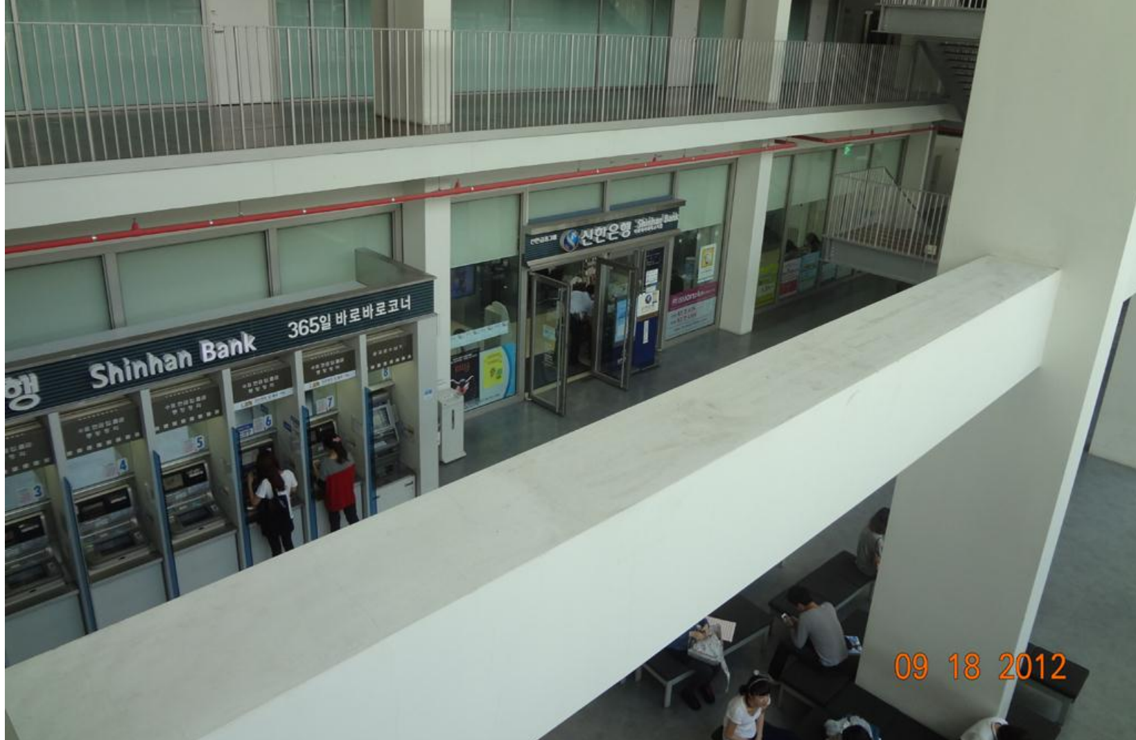
梨花女子大学内部にある銀行にて両替