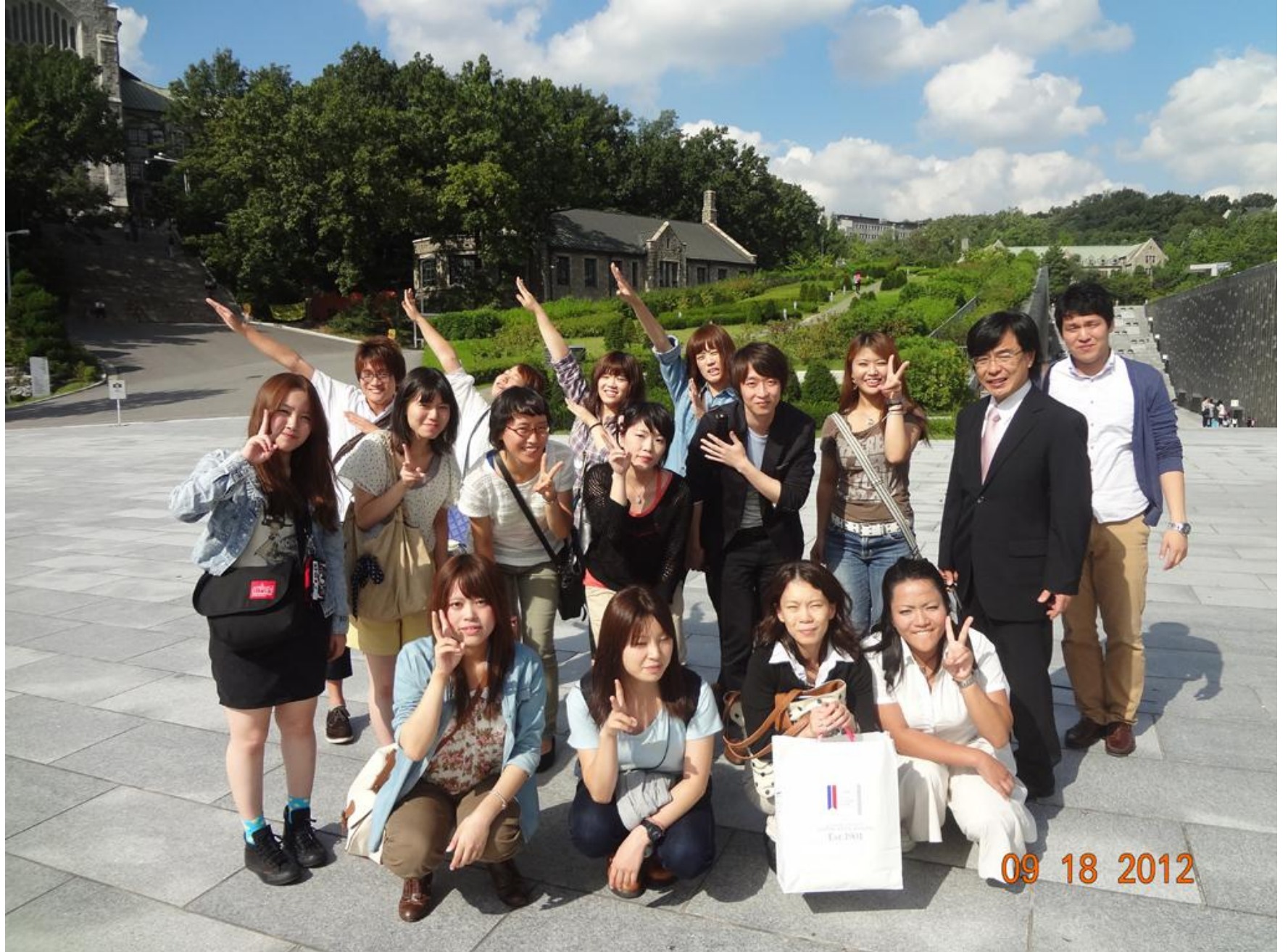
梨花女子大学キャンパスにて