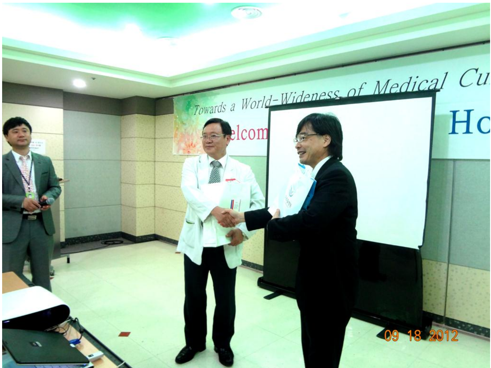
ミソドル病院院長先生とのご挨拶