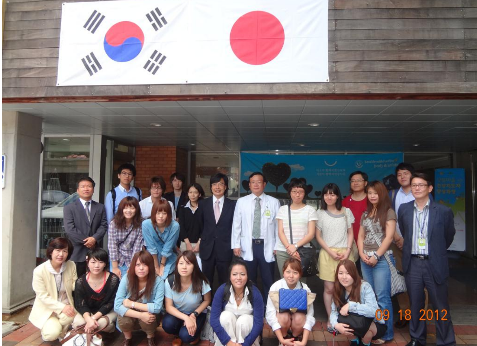
ミソドル病院、シルバーセンタ見学の後で、 両国国旗のもとで記念撮影。 熱烈な歓迎を受けました。