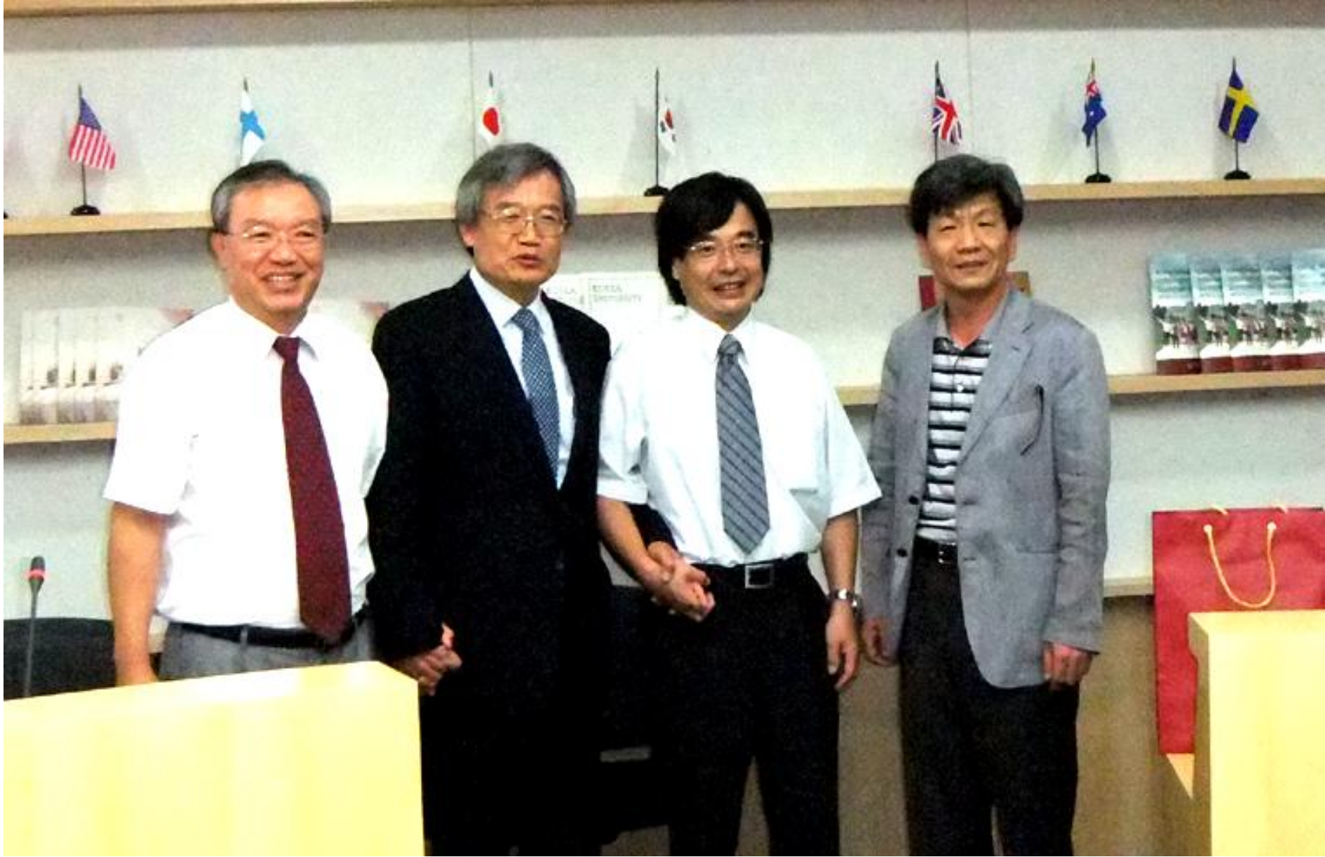
金先生、学長先生、小倉教授、副学長先生