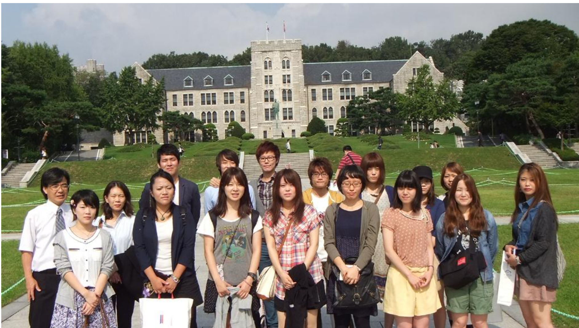
高麗大学校安岩キャンパスにて