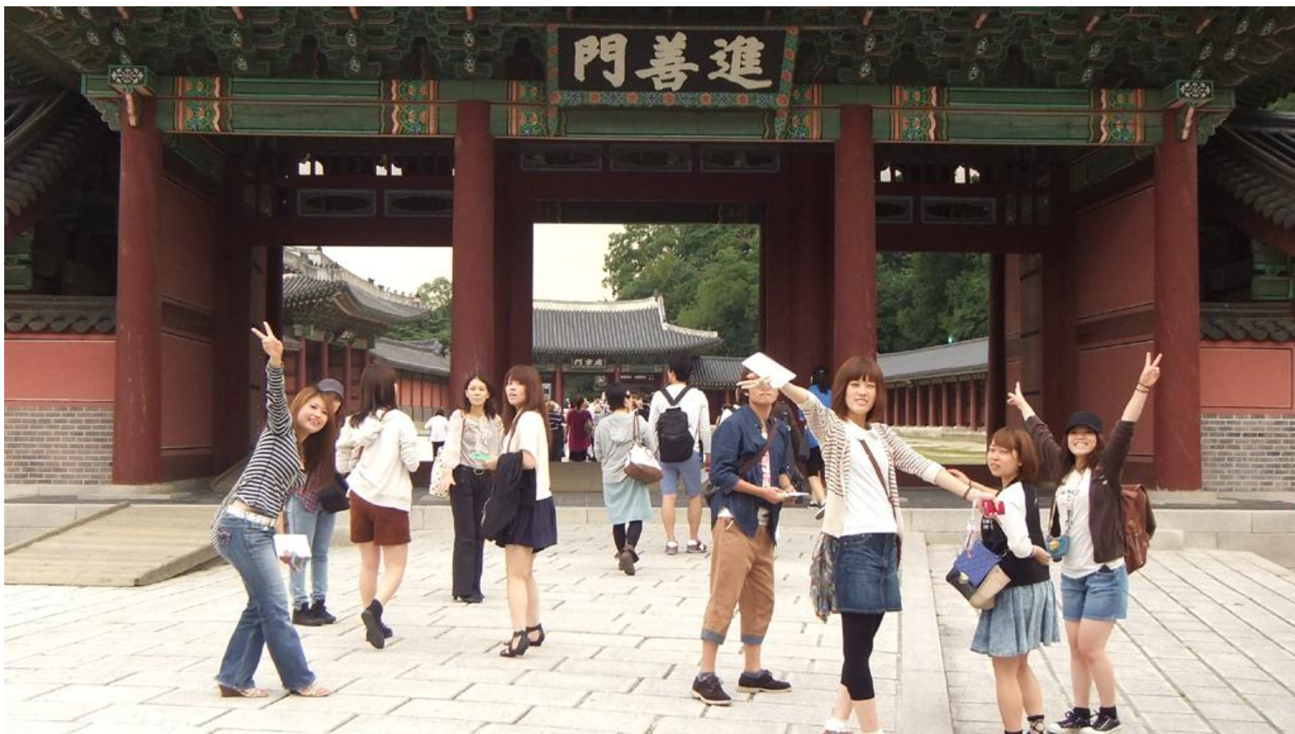
異文化交流の一つとして昌徳宮訪問 進善門の前で