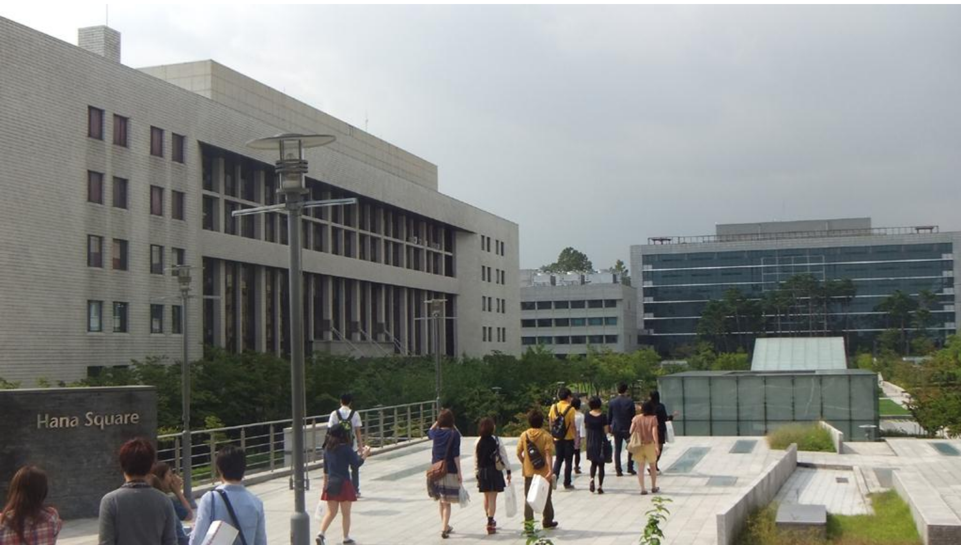
高麗大学校理工学部の見学