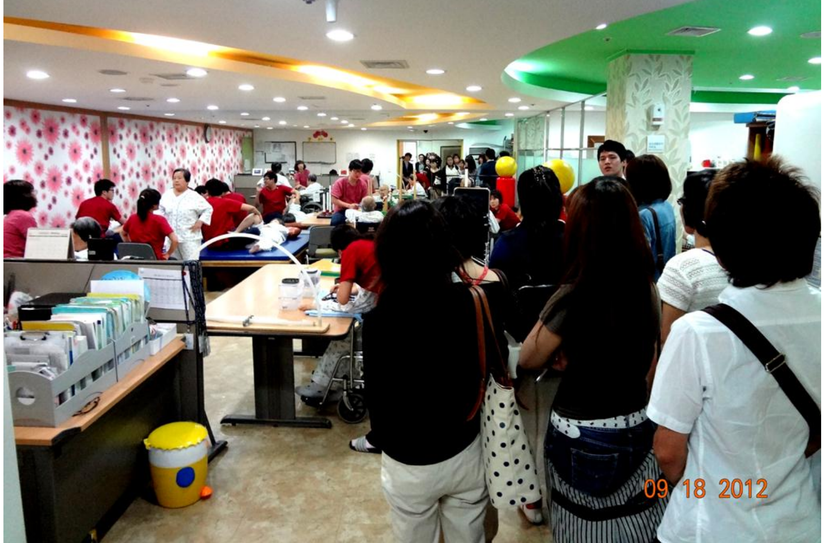
ミソドル病院リハビリ室の見学