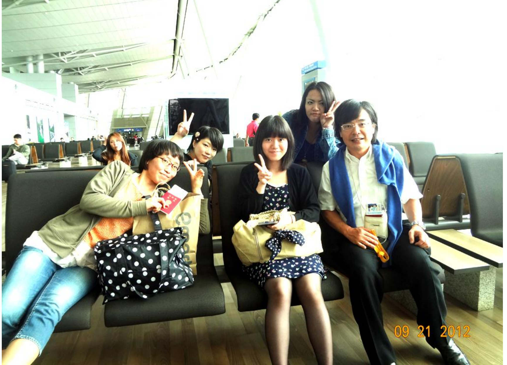
(仁川空港にて) 韓国からの帰途につく