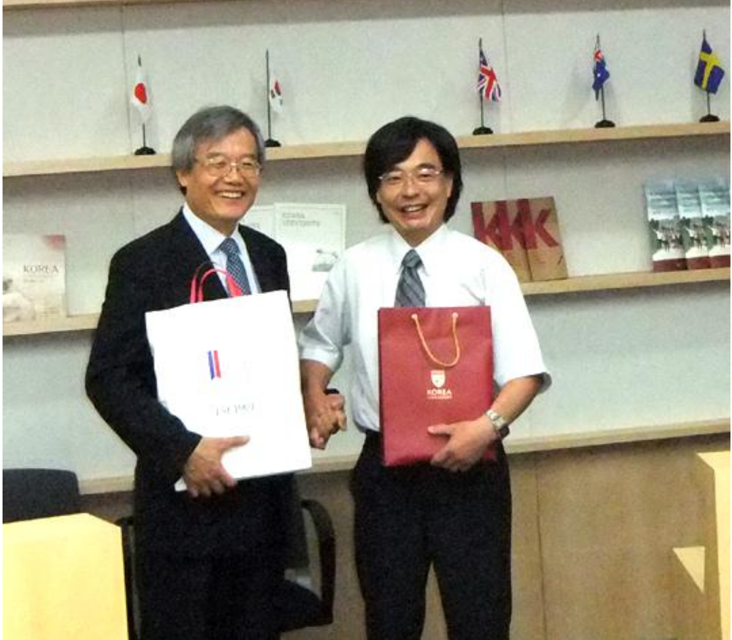
学長先生との交流