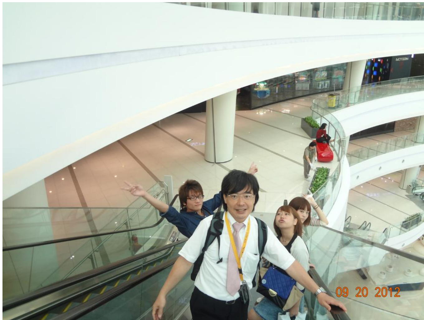
滞在ホテル近くのショッピングモール (タイムズスクエア)にて昼食