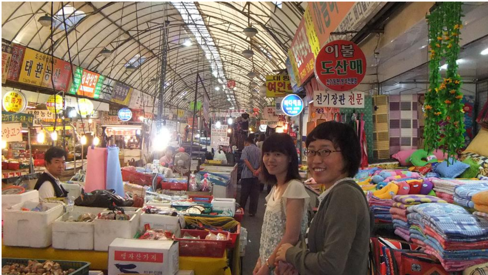
滞在ホテル近くの永登浦伝統市場にて