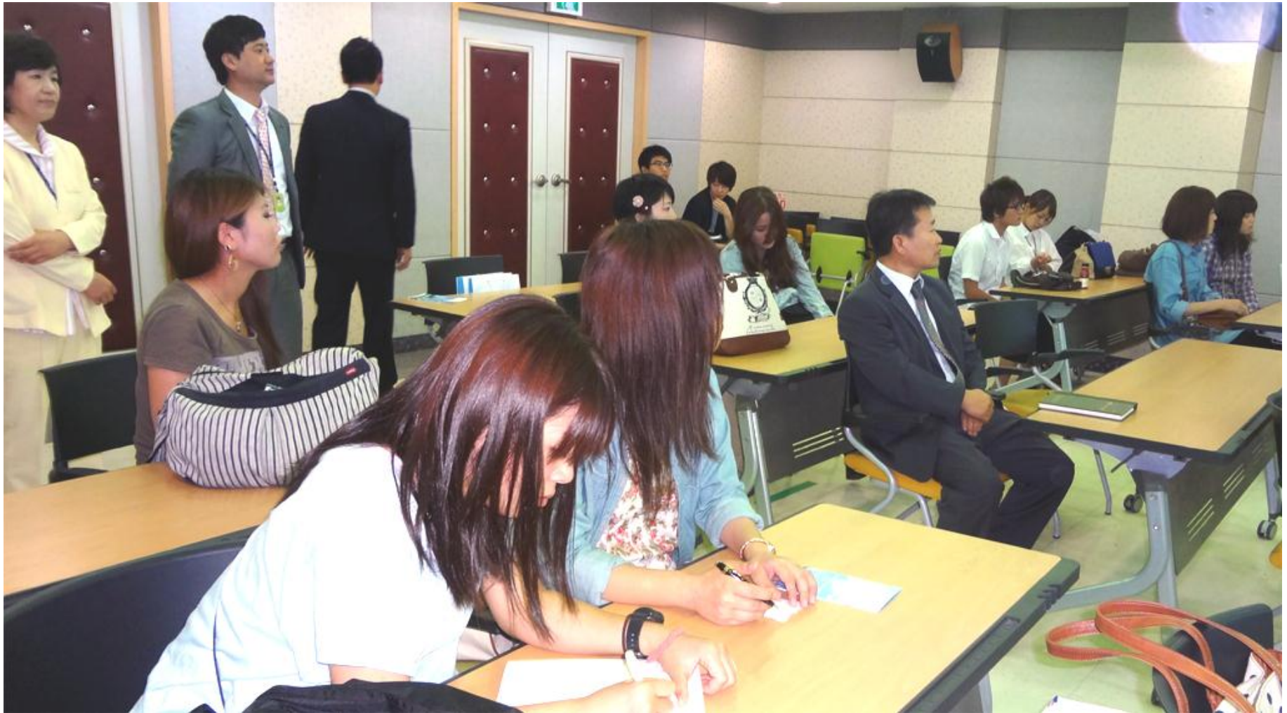
ミソドル病院にてレクチャーを受ける本学学生