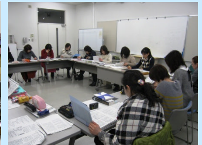
演習に取り組む第1期生