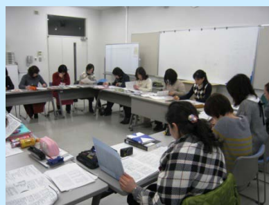
演習に取り組む第1期生