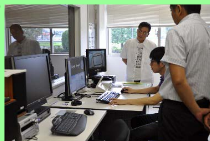
本学で開催したMRI講習会

追われ装置の性能等は業者任せとなっていた私にとって、講習会は非常に有意義なものとなりました。講習会を企画していただいた県民健康科学大学の諸先生方に感謝申し上げ、また、今後もぜひ御指導いただきたくお願い申し上げます。