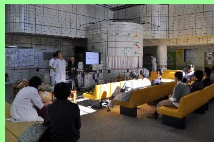
小児医療センターでの合同公開講座

良い機会であり、今後の検査をより質の高い安全なものにしていくための動機付けとなりました。放射線検査はCT・RI等まだ多くのものがあります。来年以降も本講座を継続し、患者さんの御家族や放射線に関する不安をお持ちの方々に多くの情報を発信していきたいと考えています。