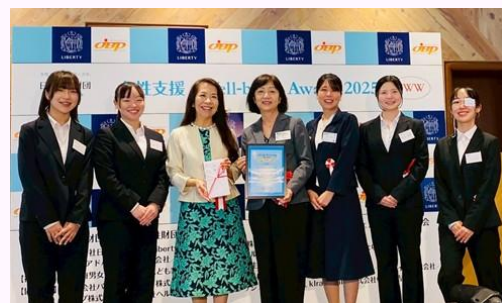
群馬ピアカウンセリング研究会の皆さん

思春期の生徒を対象に寄り添いながら、生＝性の健康をテーマにした活動を継続していることが高く評価され、ブルーエメラルド（女性支援）部門・活動賞を受賞しました。ピアサークルは高崎健康福祉大、桐生大学のメンバーとともに、群馬ピアカウンセリング研究会メンバーとして活動しています。