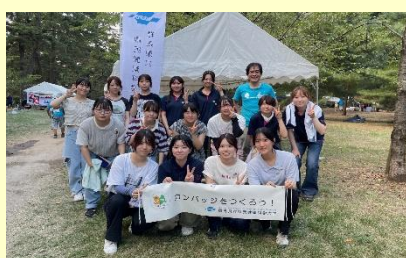
ボランティアサークルの皆さん