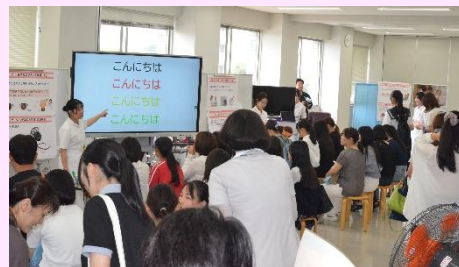
看護学部 模擬演習体験

猛暑の中の開催となりましたが、オープンキャンパスにご参加くださった高校生の皆さんにとって、今後の進路を考える上で参考となる機会にさせていただけたようです。